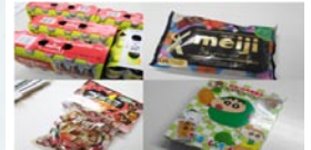
2月も差し入れやお土産をありがとうございました。

在籍する生徒の所属校 小学校 愛国・芦野・富原 中学校 美原・青陵・景雲・北・武修・富原・遠矢・別保・鶴居 高校 湖陵・江南