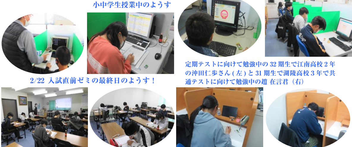
小中学生授業中のようす

★ステップゼミナールでは、中学2・3年生の新学期は3月スタートです。それは入試が3月の初めなので中3生の1年が12ヶ月ないからなのです。 小学6年生はすでに中学校の英語の勉強をスタートしています。 また、中3生は入試が終わっても高校スタートダッシュという授業があります。 これは入試に向けて一生懸命やってきたことが入試が終わったことで気が緩み、今まで積み上げてきた勉強のリズムが崩れてしまわないように高校の内容の先取りをするものです。3月25日から春期講座が始まります。