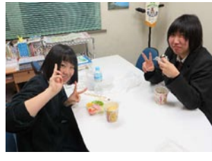
高校生も2月は学年末テストだったので、いつもより一生懸命やってきました。したがって結果は良いようです。