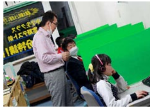
和ちゃんも今年は6年生か!