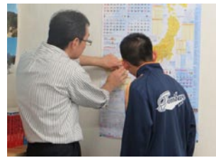
本州四国連絡橋の説明を地図で