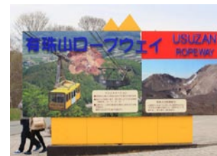
登別の友人宅に泊まり昭和新冠に50年ぶり(中学校の修学旅行)に。いまも沢山、観光客がいてびっくり! ガラス館は一見の価値あります。