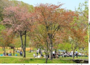
5/22 天気良かったので写真でも、と別保公園のサクラ祭りへ、桜の木少な過ぎ!