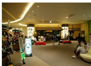
GW、話の種に千歳空港の温泉(1500円)に行きましたが、白老町虎杖浜の420円のアヨロ温泉の方がずっとよかったです。