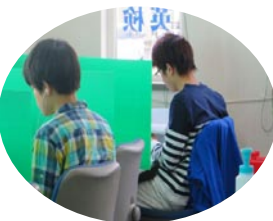
附属中1、2生 試験は3日から