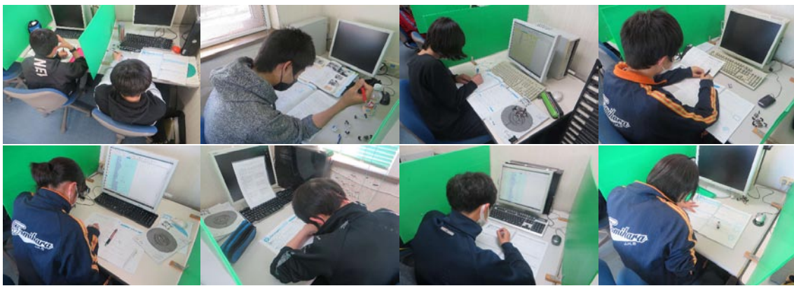
定期テストに向けての取り組む中学生（上2段） 第1回の漢字検定に向けて（下段）