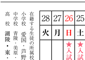
在籍する生徒の所属校 小学校 愛国・芦野・富原 中学校 青陵・美原・景雲 附属 富原・別保 高校 湖陵・東・高専