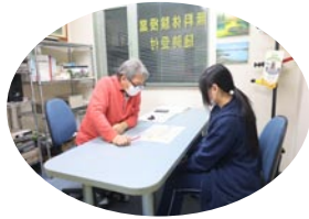
道コン結果についての面談