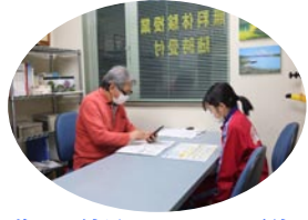
道コン結果についての面談