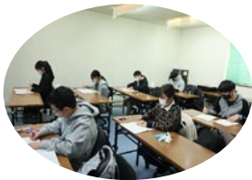
22年度冬期講座の様子