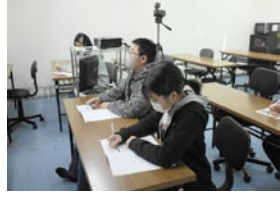
22年度冬期講座の様子