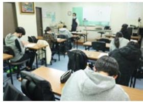
1/10、11 学力コントロール受験

管内では以前から評価の高かった（塾でも）標茶高校（総合学科）が80名の募集に対して60名の出願という、意外な出願者数の多さになりました。標茶高校の評価がかなり浸透してきた結果だと思えます。 今後の格差社会での自分の将来を考えると、特に男子は、今回セブン銀行の社長を輩出した釧路高専を勧めます。釧路高専は一流企業からの評価が高く求人倍率も30倍以上と格差社会が広がる中で充実した人生を送るチャンスが広がります。 近年は5年終了後に勉強だけでなく、色んな事身につけるために大学へ進む学生も増えています。また大学へ進むなら、ウクライナ問題で露呈した日本の産業基盤の弱さを見ると、今は農業、漁業、林業の分野、もちろん科学技術、IT技術の学部を選択するのもいいと思います。 ずうーと前から言っていますが15の春、18の春の選択が自分の人生に大きく影響します。 格差社会の中で生きていくには目標を持ちそれに向かって頑張るしかないのです！