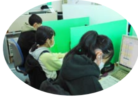
22年度冬期講座の様子