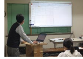
1/25 22年度の公立高校の入試倍率が発表されたので、詳しく説明